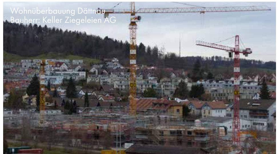
Wohnüberbauung Dättnau Bauherr: Keller Ziegeleien AG

Titelbild: TWINS, die neuen MAN-Hakenfahrzeuge