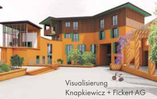
Visualisierung Knapkiewicz + Fickert AG