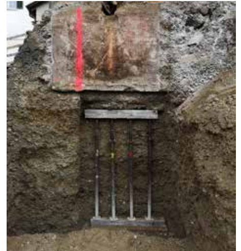
Unterfangung in Etappen von denkmalgeschütztem Objekt