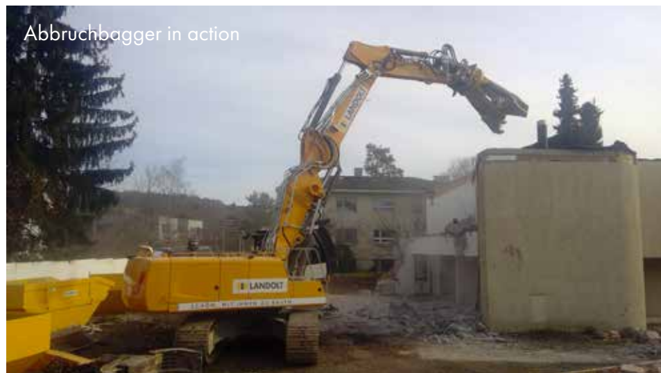
Abbruchbagger in action