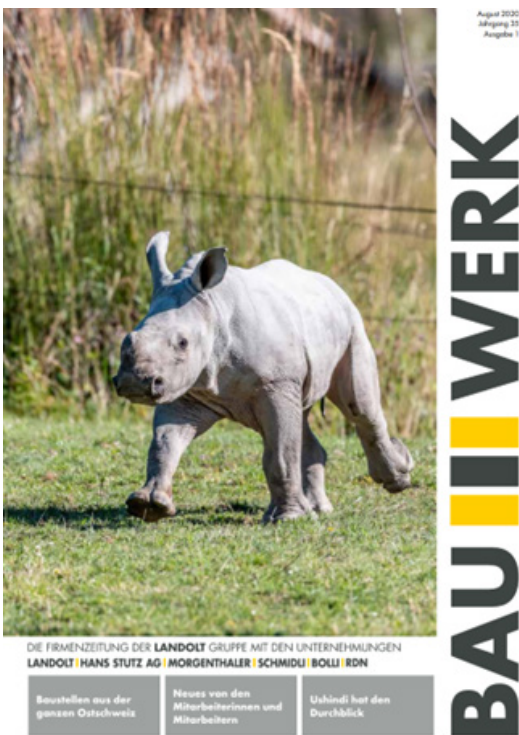
Titelblatt der Firmenzeitung 2020

Durch diesen jährlichen Beitrag möchten wir auch zukünftig den Zoo Zürich im Bereich des Artenschutzes in gewissem Masse unterstützen.